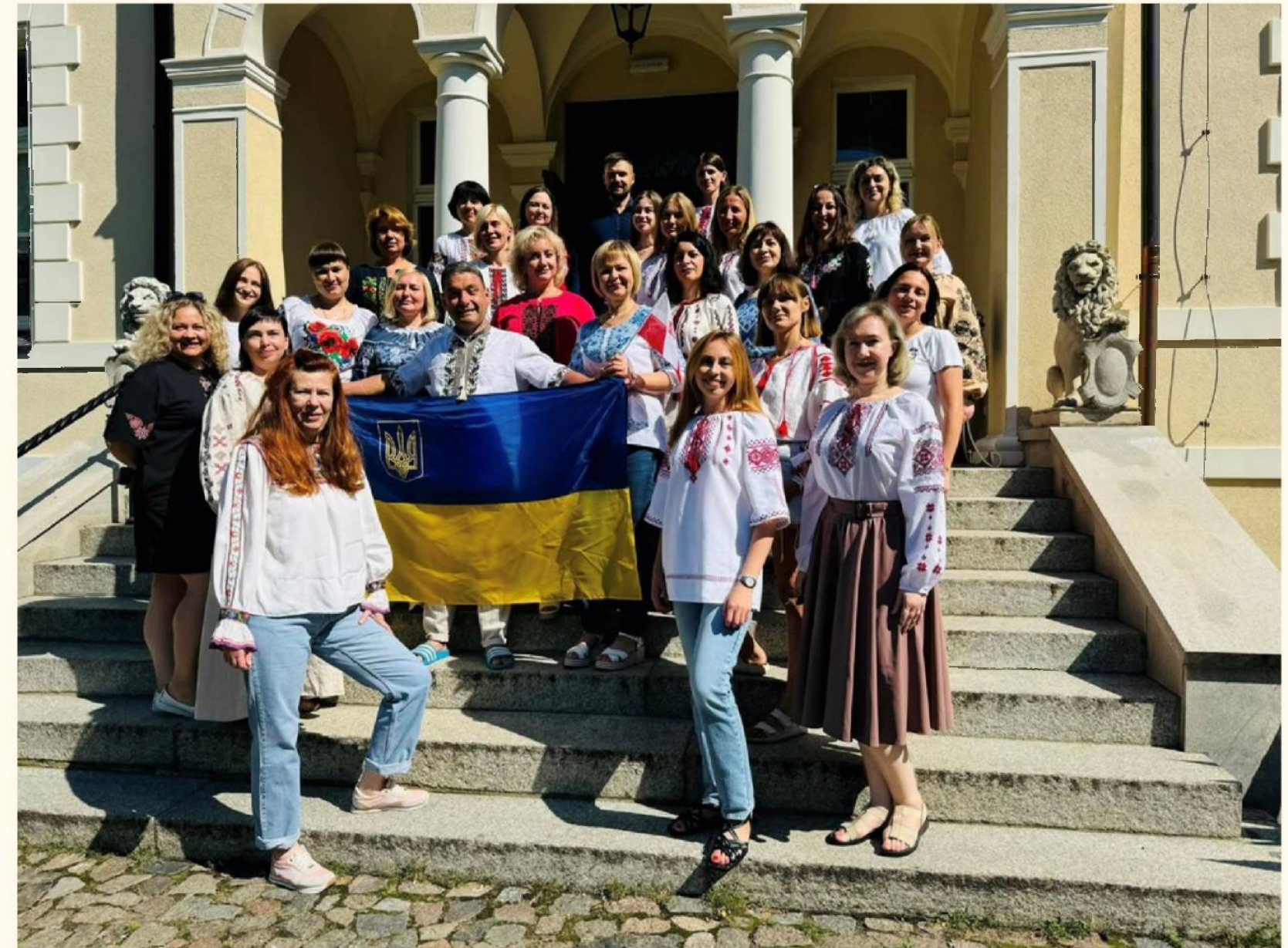
Учасники з 28 університетів України

Академічна мобільність реалізована під час роботи літньої школи «Internationalization and Internationalization at Home through Virtual Exchange: Creating a Motivating Environment for Collaborative Online International Learning (COIL)» в рамках проєкту «BNI-UE-2023-23: Співпраця Університету Адама Міцкевича з університетами України в рамках альянсу Європейських університетів»